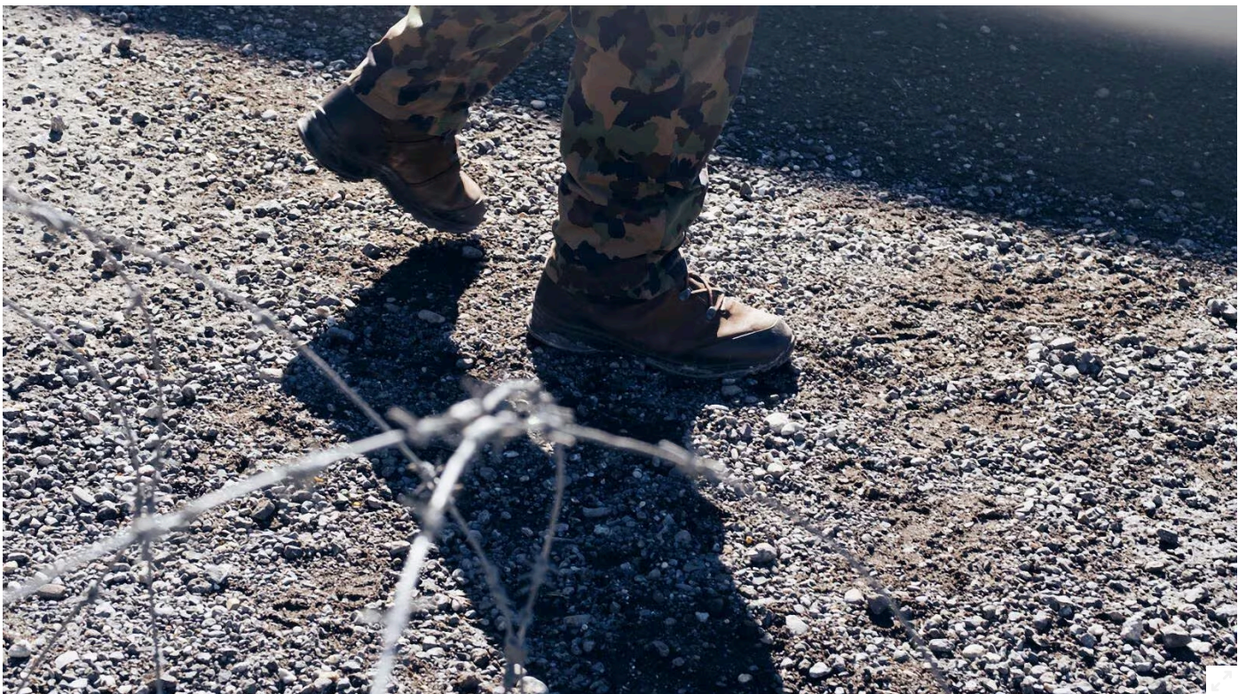
Service de garde à l'école des officiers de la logistique 40, le 4 novembre 2025 à Oberdiessbach, Berne.

OPINION. La sécurité sans la paix n'est pas la sécurité, et une politique de sécurité sensible au genre n'est pas seulement plus juste, elle est plus efficace, écrit Deborah Schibler, directrice de l'organisation PeaceWomen Across the Globe